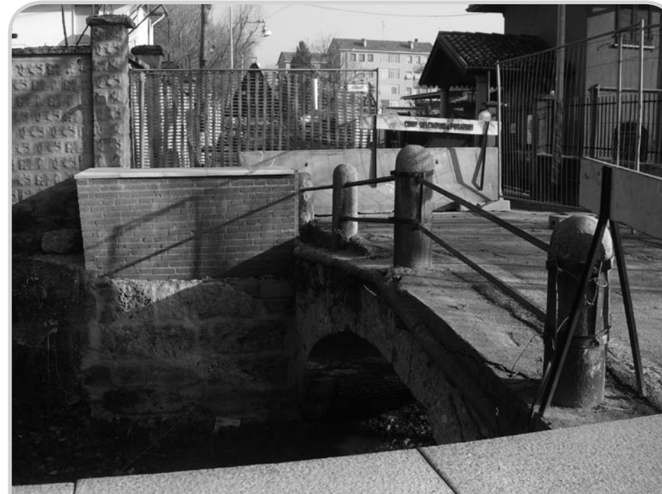
In via Campazzino è stato snaturato lo storico ponticello sul Ticinello, il Comitato di salvaguardia con sede in Piazza Chiaradia, ha mandato un esposto in Comune, ritenendo le sponde costruite inadatte alla struttura.

Polizze di assicurazione per la casa, gli infortuni, Pensioni integrative, R.c. Professionali, R.c. Auto. Preventivazione e consulenza gratuite. Professionalità e cortesia al Vostro Servizio.