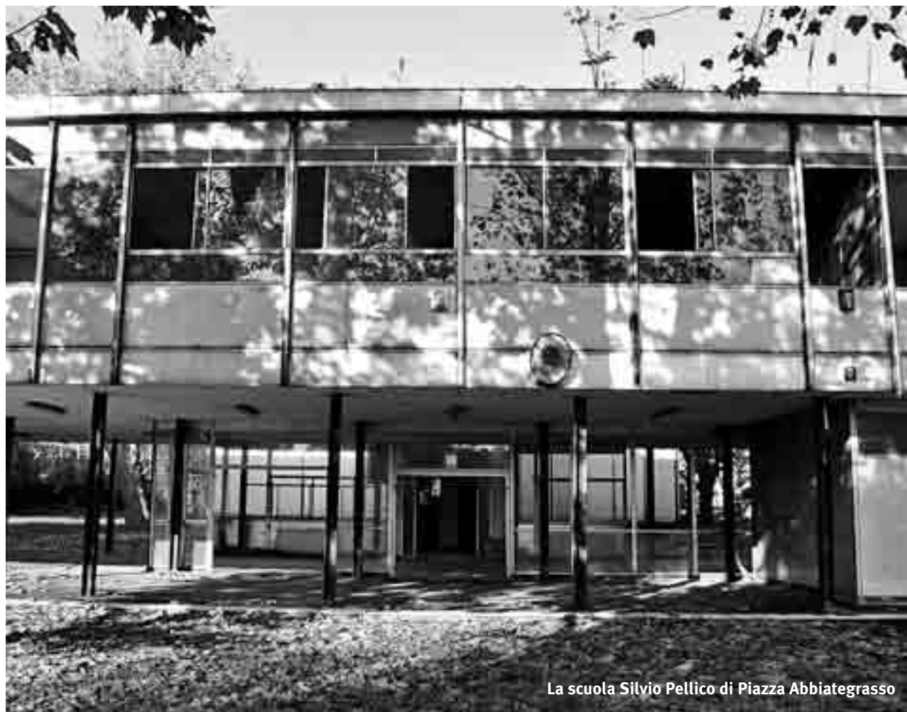
La scuola Silvio Pellico di Piazza Abbiategrasso

L'offerta formativa d'altronde è seriamente minacciata dai tagli ai bilanci, abbiamo visto "ridimensionati" quasi tutti i progetti presentati dalle interclassi a causa dell'insufficienza dei fondi. Che dire? Vita dura per le scuole! Parliamone, confrontiamo dati e situazioni, non restiamo isolati ognuno nella sua scuola. Chiediamoci sempre se per la società il costo dell'ignoranza non sia infinitamente più alto di qualsiasi investimento sulla cultura.