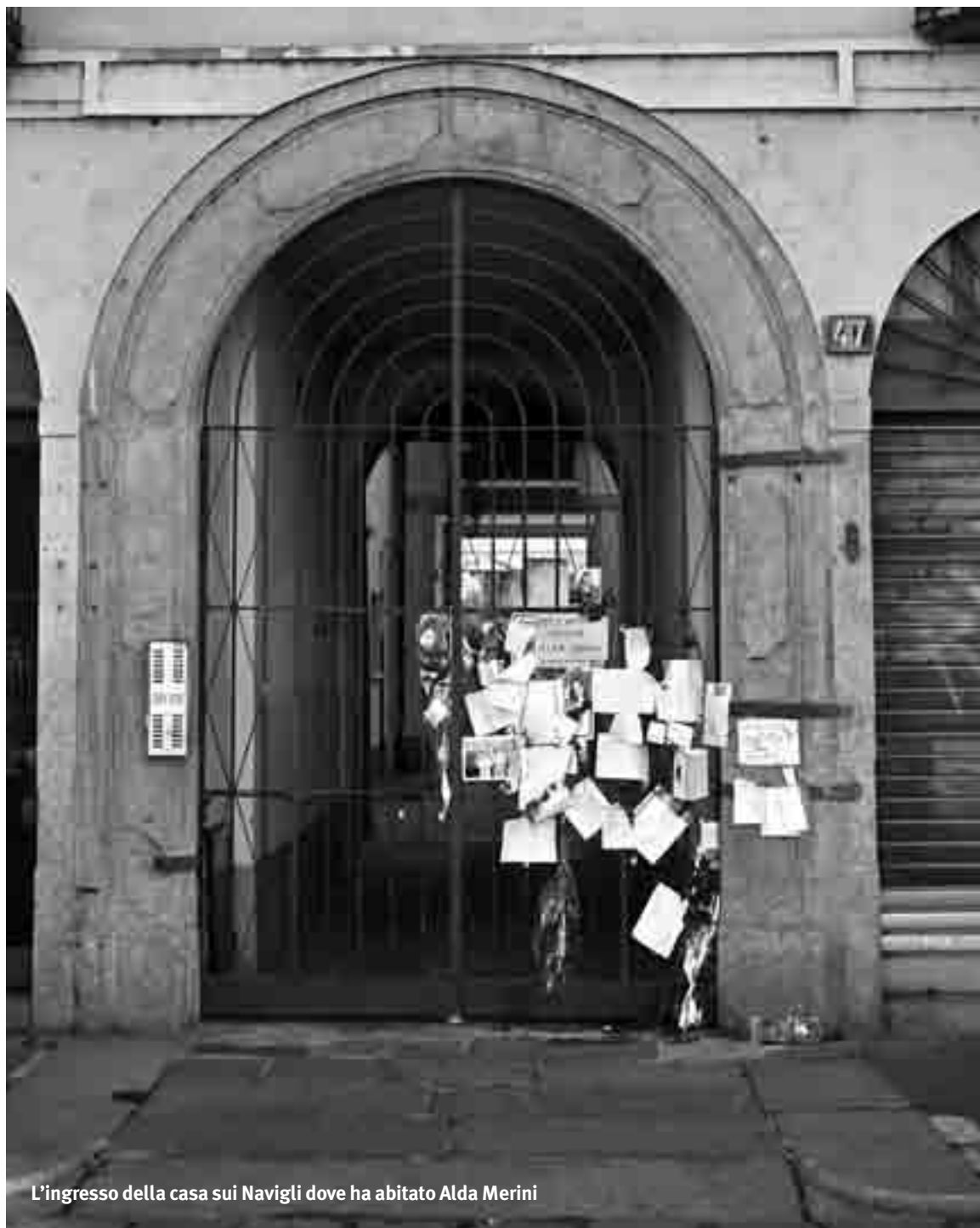
L'ingresso della casa sui Navigli dove ha abitato Alda Merini