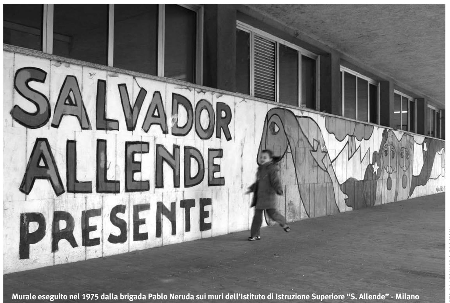
Murale eseguito nel 1975 dalla brigada Pablo Neruda sui muri dell'Istituto di Istruzione Superiore "S. Allende" - Milano

economico all'interno della società. Al culmine di questo progetto di giustizia sociale si collocano la riforma agraria e la nazionalizzazione delle miniere di rame. Già nel 1972 Allende deve affrontare l'ostilità della borghesia contraria alla sua politica economica e quella della sinistra più estrema che punta ad andare oltre la legalità costituzionale e parlamentare (Roverato, 1990). Nel 1973 il Presidente decide di inserire esponenti dell'esercito cileno nel governo: decisione che si esponeva al rischio della possibilità di un colpo di stato, permettendo però la vittoria di Unidad Popular alle elezioni politiche dello stesso anno. La situazione è ormai troppo critica a causa dell'inflazione e della crisi economica provocata anche dagli Stati Uniti, i quali fanno precipitare il valore del rame sul mercato mondiale (Stabili, 1991). Inoltre aumentano gli scioperi e continua l'ostilità della borghesia. Nonostante ciò il presidente vuole scongiurare l'ipotesi di un colpo di Stato. Tale scelta è invece attuata dai militari, i quali l'11 Settembre 1973 fanno bombardare il palazzo presidenziale causando la morte di Salvador Allende e dei suoi collaboratori. Dopo il golpe si instaura in Cile una dittatura militare sotto il generale Augusto Pinochet, il quale abolisce la Costituzione e tutte le conquiste sociali attuate dopo lotte e contrasti nel corso degli anni difficili della presidenza Allende.