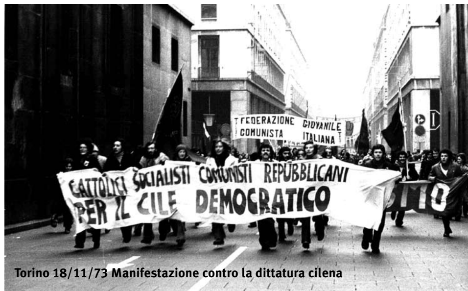
Torino 18/11/73 Manifestazione contro la dittatura cilena

Il mondo osservò con orrore come la politica del nuovo governo in cile segnasse inde-