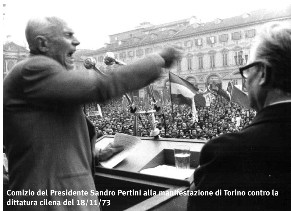
Comizio del Presidente Sandro Pertini alla manifestazione di Torino contro la dittatura cilena del 18/11/73