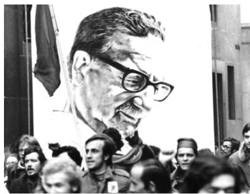
Torino 18/11/73 Manifestazione contro la dittatura cilena

Queste sono le mie ultime parole, con la certezza che il mio sacrificio non sarà vano. Ho la certezza che, almeno, ci sarà una sanzione che castigherà la fellonia, la viltà e il tradimento" (Deiana, a cura di, 1994, pp. 69-70)