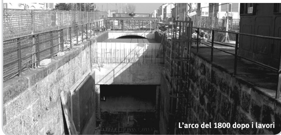
L'arco del 1800 dopo i lavori

Mostriamo alcune foto e invitiamo i lettori a visitare il cantiere ed esprimerci la loro opinione.