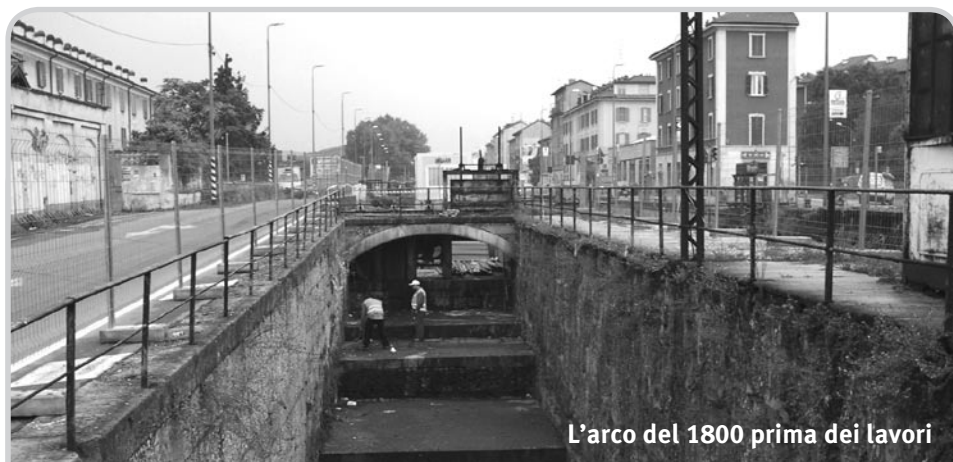
L'arco del 1800 prima dei lavori